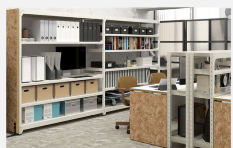
耐荷重150kg/1段のスチールタイプもあり、収納重量に応じてお選びいただけます。