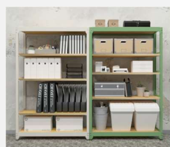
カラーはアイボリーとグリーンの2種類。 4段/6段 木棚板はウレタン樹脂塗装を施しているのでお手入れも簡単です。

オフィス・ホーム・店舗・・・シーンや用途に合わせて連結も棚位置調整もカスタム自在。