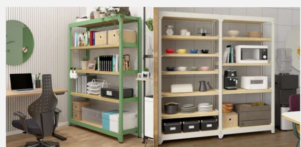
オフィスはもちろん、ホームや店舗什器とも高相性。 棚板の耐荷重は90kg/1段と頑丈なのでコピー用紙や工具もラクラク収納。 棚板は5cmピッチで調整可能で、収納物のサイズに合わせてカスタマイズできます。